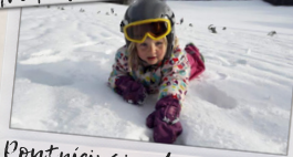
Poutníci sjezd Zámkyšle