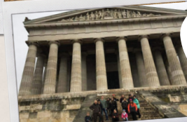
Medvědi a Gabrety v Německu